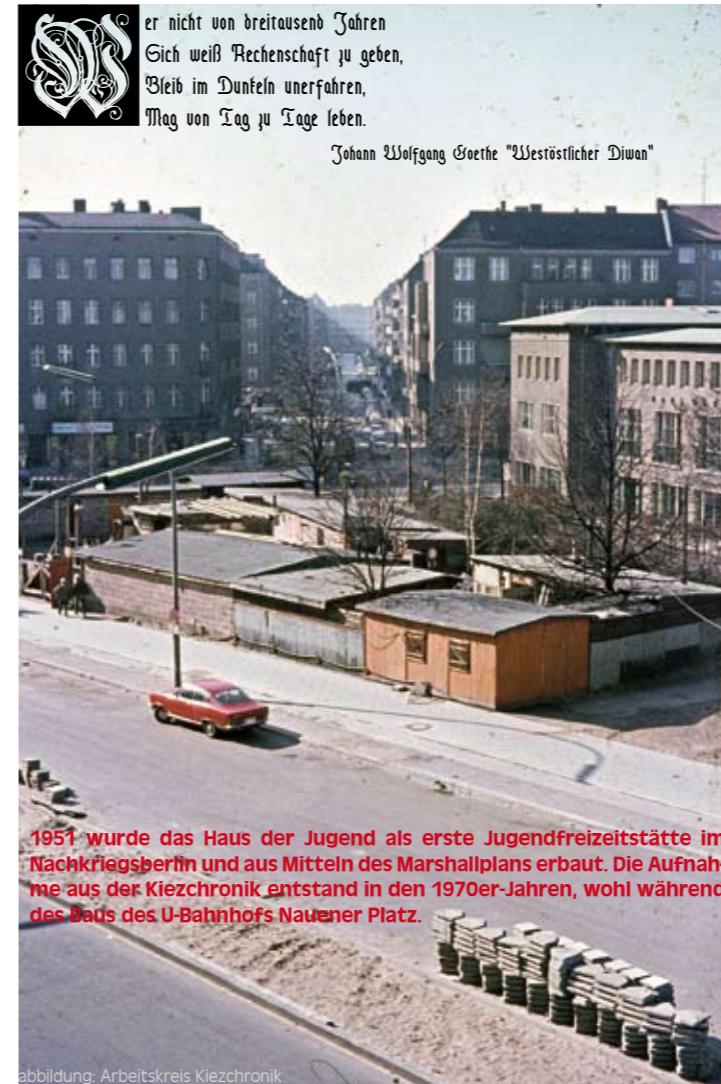
1951 wurde das Haus der Jugend als erste Jugendfreizeitstätte im Nachkriegsberlin und aus Mitteln des Marshallplans erbaut. Die Aufnahme aus der Kiezchronik entstand in den 1970er-Jahren, wohl während des Baus des U-Bahnhofs Nauener Platz.